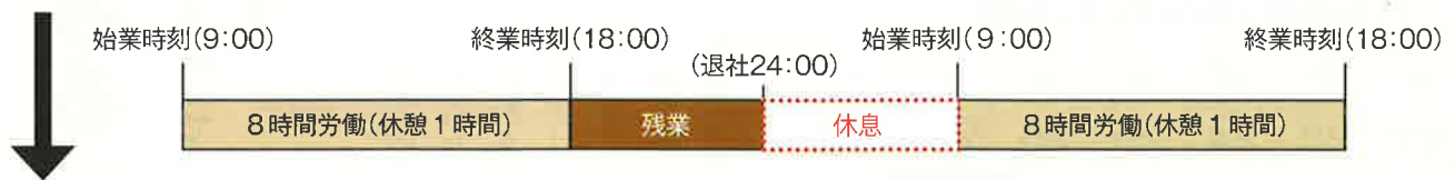
【図2】勤務間インターバル制度導入例