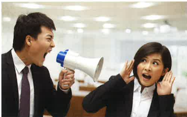
暴言などによる精神的な苦痛もパワーハラスメント