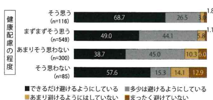
図2 勤め先の健康配慮別・不要不急の外出

このほかテレワークについても訊いています。コロナ禍収束後もテレワークを行いたいかについては、「そう思う」が前回の26.0%から今回は34.7%に増加。「そう思う」「どちらかと言えばそう思う」と答えた人の割合は、4回の調査で最多の76.4%に達しました。