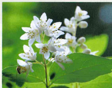
※各月の異名を集め、代表的なものの由来を説明します。

（他の異名）陰月（いんげつ）、乾月（けんげつ）、木葉採月（このはとりづき）、夏初月（なつはづき）、麦秋（ばくしゅう）、清和（せいわ）