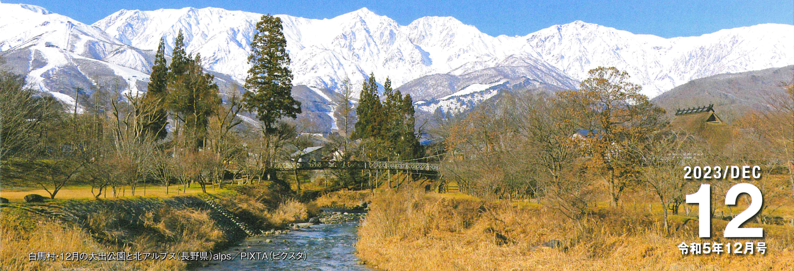
白馬村・12月の大出公園と北アルプス(長野県)